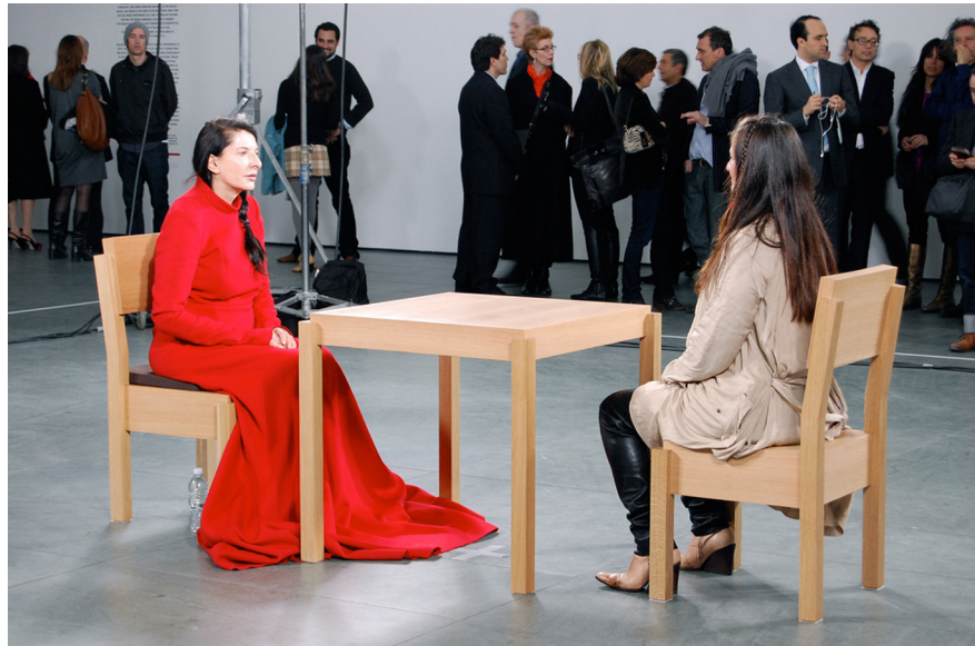
Marina Abramović, The artist is present, MOMA, New York, 2010