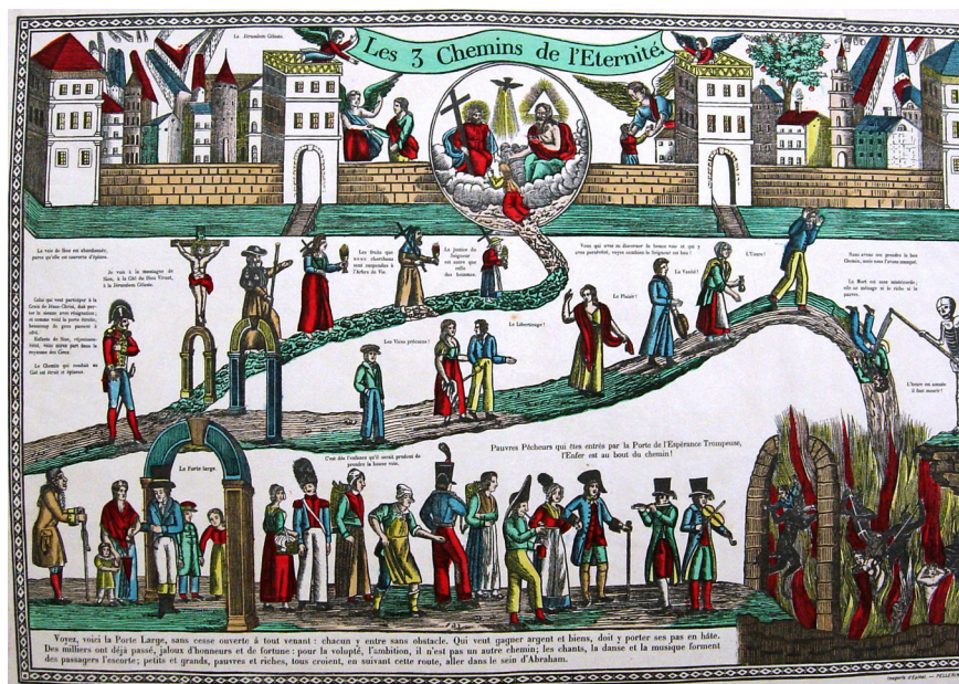
Les trois chemins de l'Éternité collectie museum 't Oude Slot Veldhoven

Het gaat om een volksprent die wordt gedomineerd door drie wegen. Een mooie brede weg die bereikbaar is door een ruime poort. Een weg die wordt bevolkt door goedgeklede en goed doorvoede mensen die lachend de weg bewandelen. Alsof het een wandelingetje voor het plezier is op een willekeurige zondagmiddag. Maar dat is wat al te zoet natuurlijk, dat kan alleen in zuur eindigen in het vocabulaire van de verhalenvertellers. En inderdaad een vreeswekkende duivel trekt aan het einde van de feestelijke route de lichaamsgenieters met een grote haak de eeuwige brandende verdoemenis in. Eerst het zoet? Dat is een omkering van de bedachte volgorde, dan moet daarna het zuur wel volgen. En wel eeuwig.