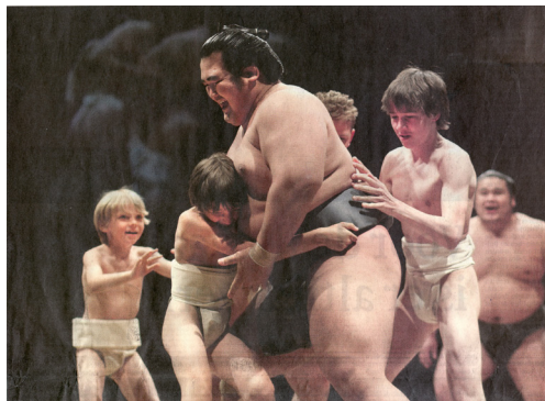
Sumoworsteelaars

Ook in beeld kunnen we dezelfde vergelijking door-trekken. Beelden die passen bij het tweede deel van de vergelijking kunnen we gewoon in de krant vinden.