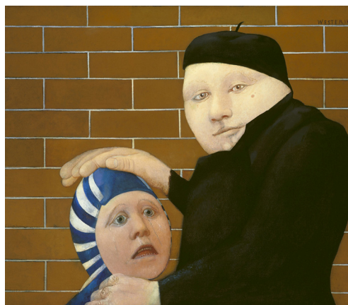
Co Westerik, De schoolmeester, uit: http://www.aartvanzoest.nl/westerik_schoolmeester

Beelden zeggen soms meer dan duizend woorden, als het om beelden gaat die met een doel zijn vormgegeven. Met het doel om iets te verbeelden, iets in beeld te brengen, iets te communiceren. Een bekend schilderij in dit verband is dat van 'De schoolmeester met kind' van Co Westerik. Een schoolmeester die een kind haast letterlijk kneedt en daarbij zichtbaar niet al te zachtzinnig te werk gaat. Die gewoon zijn werk doet en daar niet al te veel emotie bij toont. De vraag: 'Was het leuk op school?' past dan ook niet bij het verhaal achter dit schilderij.