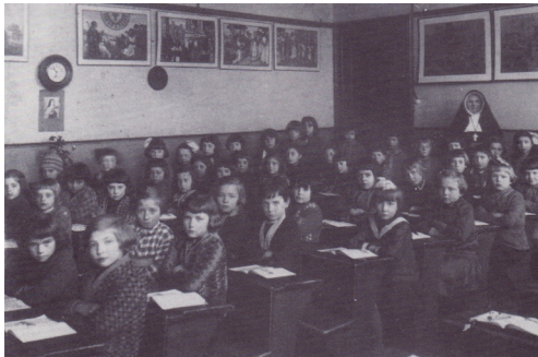
uit: Van Sleenwen, Jeugtherinneringen, Boekel, 1992

Foto's van een klaslokaal of een school zouden ons