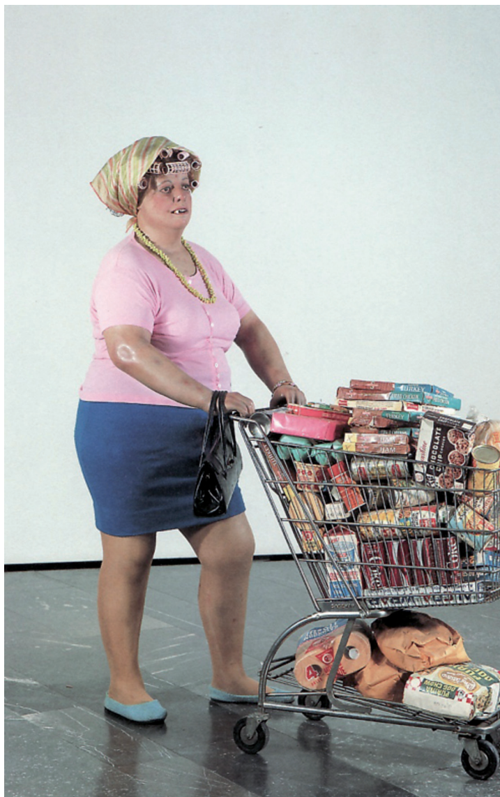
Duane Hanson, Supermarket Shopper, 1970, uit: Thomas Buchsteiner en Otto Letze (red.), Ostfildern-Ruit, 2001, Hatje Cantz Publishers

Een ander voorbeeld is de bibliotheek. Voorheen een leeszaal waar de boeken werden aangeboden op basis van het idee dat lezen goed voor je is. Vanuit het idee van Bildung, verheffing en emancipatie. Nu een kennisdepot waarin je je eigen weg kunt vinden met behulp van aquabrowsers en computertechnieken die jouw keuze en voorkeur vertalen naar informatie