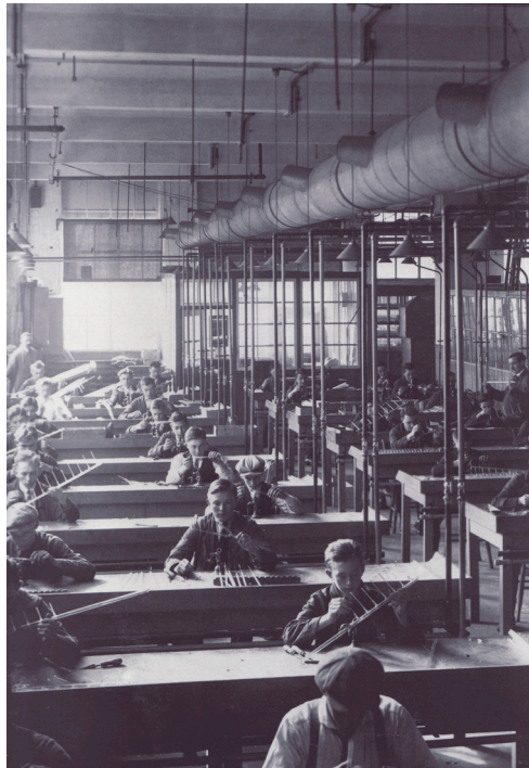
uit: Ach lieve tijd, Eindhoven, deel 4 De boeiende historie vande Eindhovena- ren en Philips

Deze foto vertoont veel overeenkomsten met foto's van productieprocessen uit die tijd. De industrie was volop in ontwikkeling en het productieproces werd steeds verder geautomatiseerd. Een productielijn kan het beste vergeleken worden met een machine waar aan de ene kant grondstoffen in worden gestopt en aan de andere kant het product uit komt. De handelingen die verricht moeten worden om de grondstof in een leverbaar product om te zetten, waren