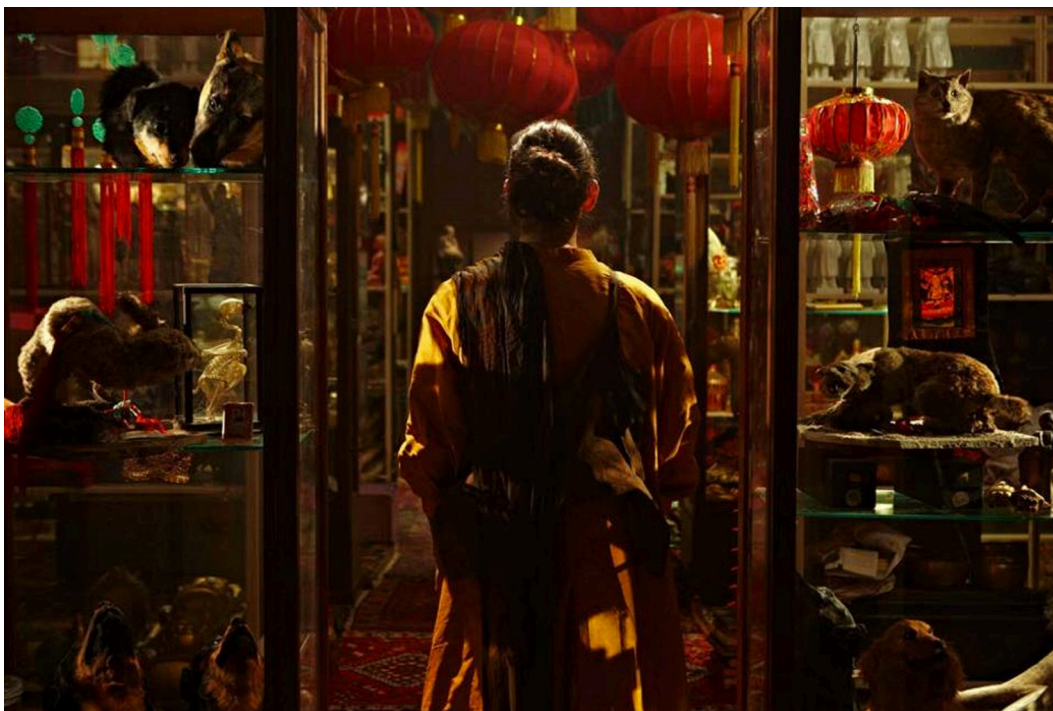
Still uit Disorient, Fiona Tan, 53th Biennale di Venezia, http://www.artknowledgeenews.com/fiona-tan-to-represent-the-dutch-pavilion-at-the-53rd-biennale-di-venezia.html

Bij de wisseling van het millennium is op allerlei manieren duidelijk geworden dat er ook grenzen zitten aan die individualisering. De aanslagen van 11 september 2004, de plotselinge populariteit van Fortuyn, de moorden op Fortuyn en Van Gogh leerden de samenleving onder andere dat vrijheid ook een prijs vraagt. En zijn we wel bereid om die prijs te betalen? Blijkbaar niet want vanaf die tijd zijn regelge-