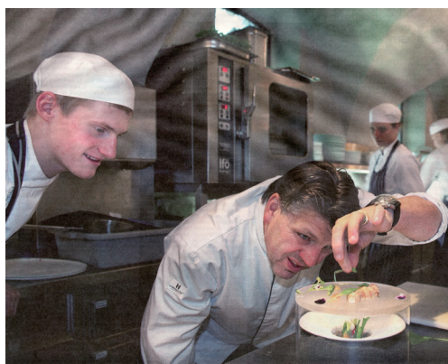
Vakmanschap, NRC 28-03-2009