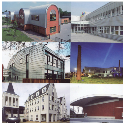
Schutblad Aap noot mis, de basis van de brede school, Architectuur Lokaal, 2008

En hoe ziet onderwijs er vandaag de dag uit?