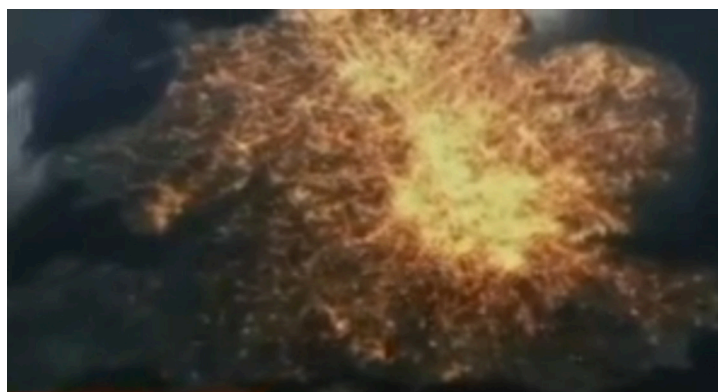
Britain from above, UK Telephone network

Het alledaags gebruik van de communicatiewisselingen die plaats vinden via de mobiele telefoon vragen om een enorm netwerk en organisatie om die verbindingen voortdurend mogelijk te maken. Een hele industrie die onderlinge communicatie ondemand mogelijk maakt. Een goede indruk van de betekenis van dat 'back-office-netwerk' krijg je als je op de site van Britain from Above het filmpje opzoekt dat het dataverkeer in en rond London zichtbaar maakt. (4)