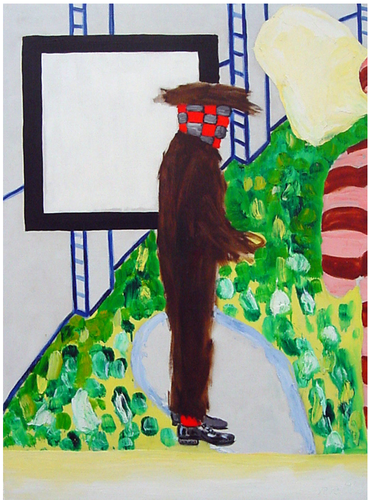
Gesprek in de tuin, roger Raveel, Raveelmuseum, Machelen