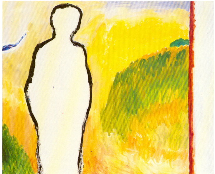
Roger Raveel, Raveelmuseum, Machelen